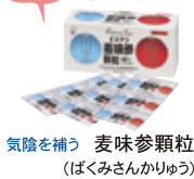
気陰を補う 麦味参顆粒 (ばくみさんかりゅう)