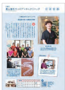
記事型1P(例:歯科特集)