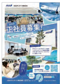
1P展開(例:ANAテレマート)