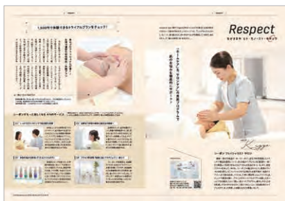
レギュラー広告(例:リスペクト)